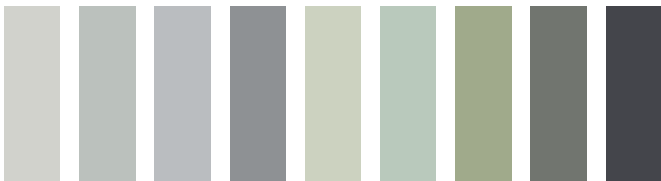
D9-b D20-c D30-b D9-d D22-b D26-b D22-d D20-e D30-f