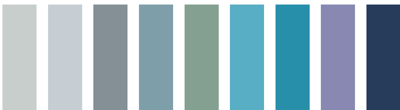
D31-b D38-b D31-d D27-d D24-d C33-d C33-e C38-d D35-f