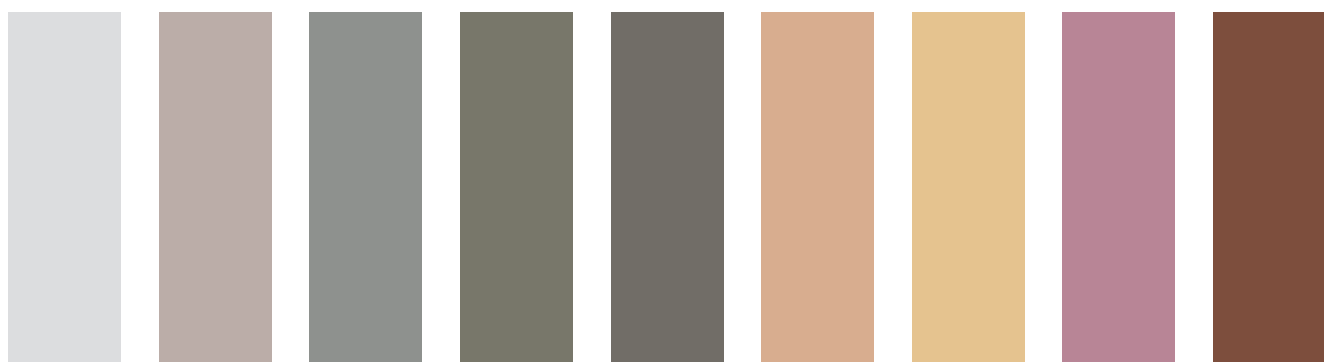
D20-a D11-c D8-d D14-e D7-e C12-c C14-c C4-d C9-f