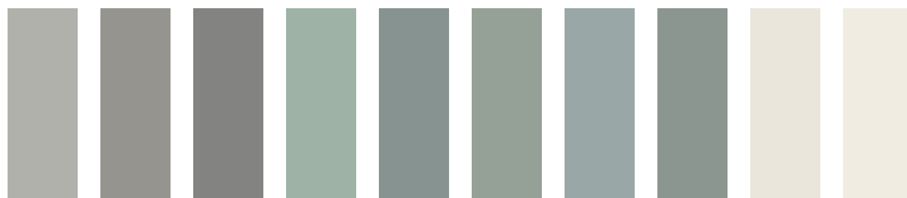
B1 B3 B5 B2+G2 B4+C1 B4+Y1 B2+C2 B4+G1 W1 W5