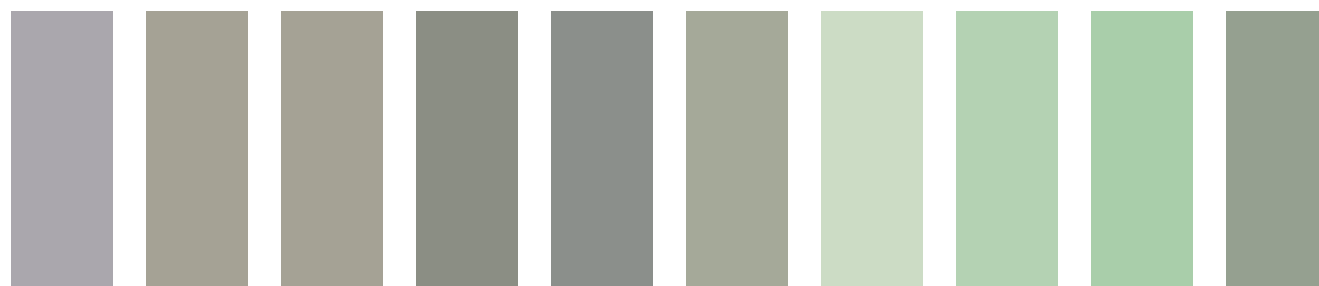
R1+C5 B2+T1 B2+E1 B4+T1 B4+E1 B2+Y1 G1 G3 G5 B2+G5