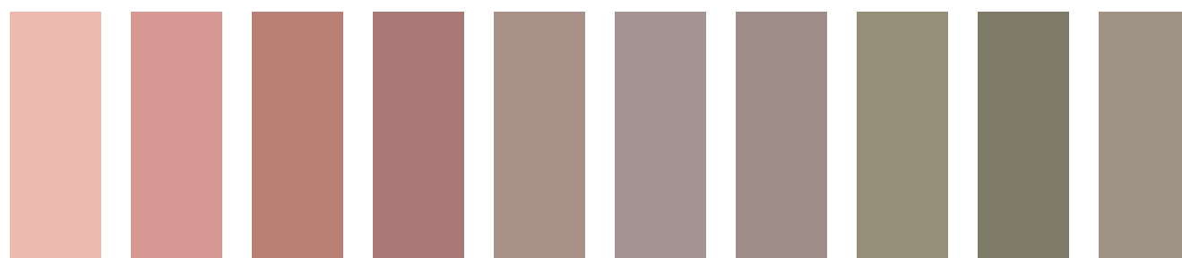
R1 R3 R5 R4+C3 B2+R2 C5+R2+W3 B2+R1 B2+E2 B5+E5 B2+T2