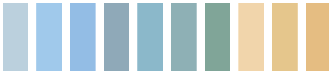
C1 C3 C5 B1+C4 C5+G1 C5+G3 C5+G5 Y1 Y3 Y5